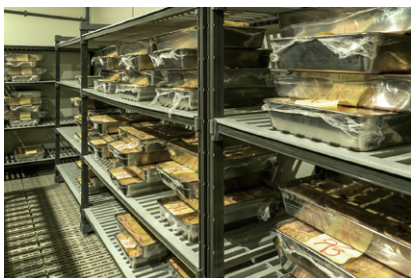
2週間かけて冷蔵庫でじっくり熟成させます