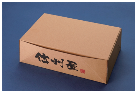
専用箱に入れクール便で発送いたします