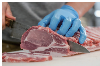
1頭買いた国産豚肉は1枚1枚手切りしています