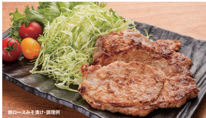
豚ロースみそ漬け・調理例